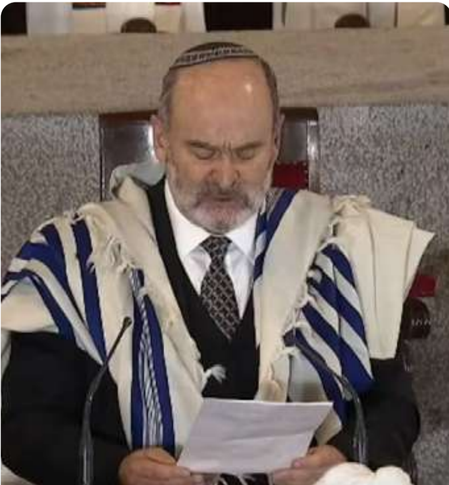
Discurso en Te Deum Ecuménico 2022 como Capellán de La Moneda

A lo largo de su trayectoria ha logrado consolidar una comunidad que hoy se encuentra más viva que nunca.