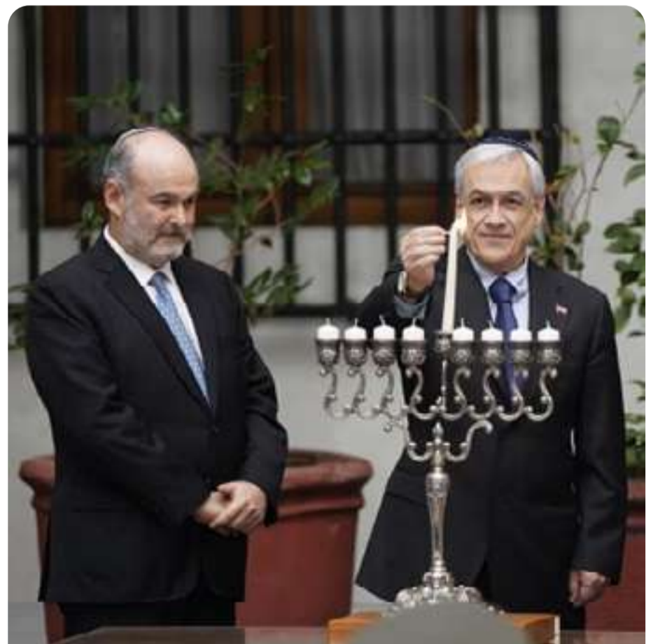
Jánuca en La Moneda con el expresidente Sebastián Piñera (QEPD)

También recuerda la impronta que dejó en el Seminario Rabínico y en la sociedad argentina por su defensa de los derechos humanos: “Muchas madres acudían a él buscando ayuda para encontrar a sus hijos desaparecidos. Fue hasta el sur del país buscando a personas y exigiendo que se los entregaran. Por esta labor, que incluso puso en riesgo su vida, recibió el reconocimiento más alto del país en el Congreso pleno, el que por primera vez se entregaba a un extranjero”.