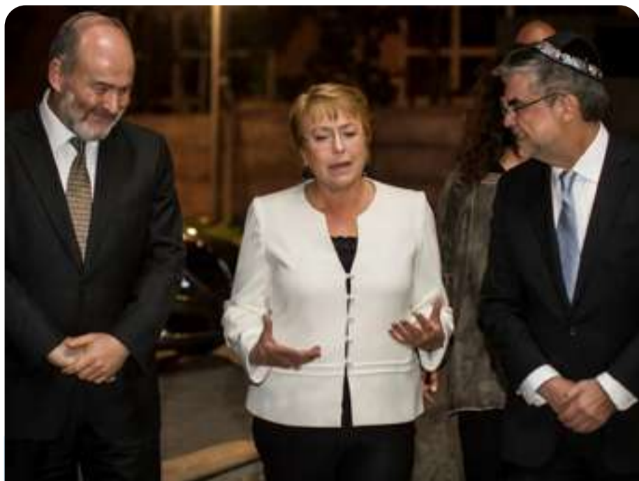
Junto a la presidenta Michelle Bachelet en la Tefilá por Chile 2016